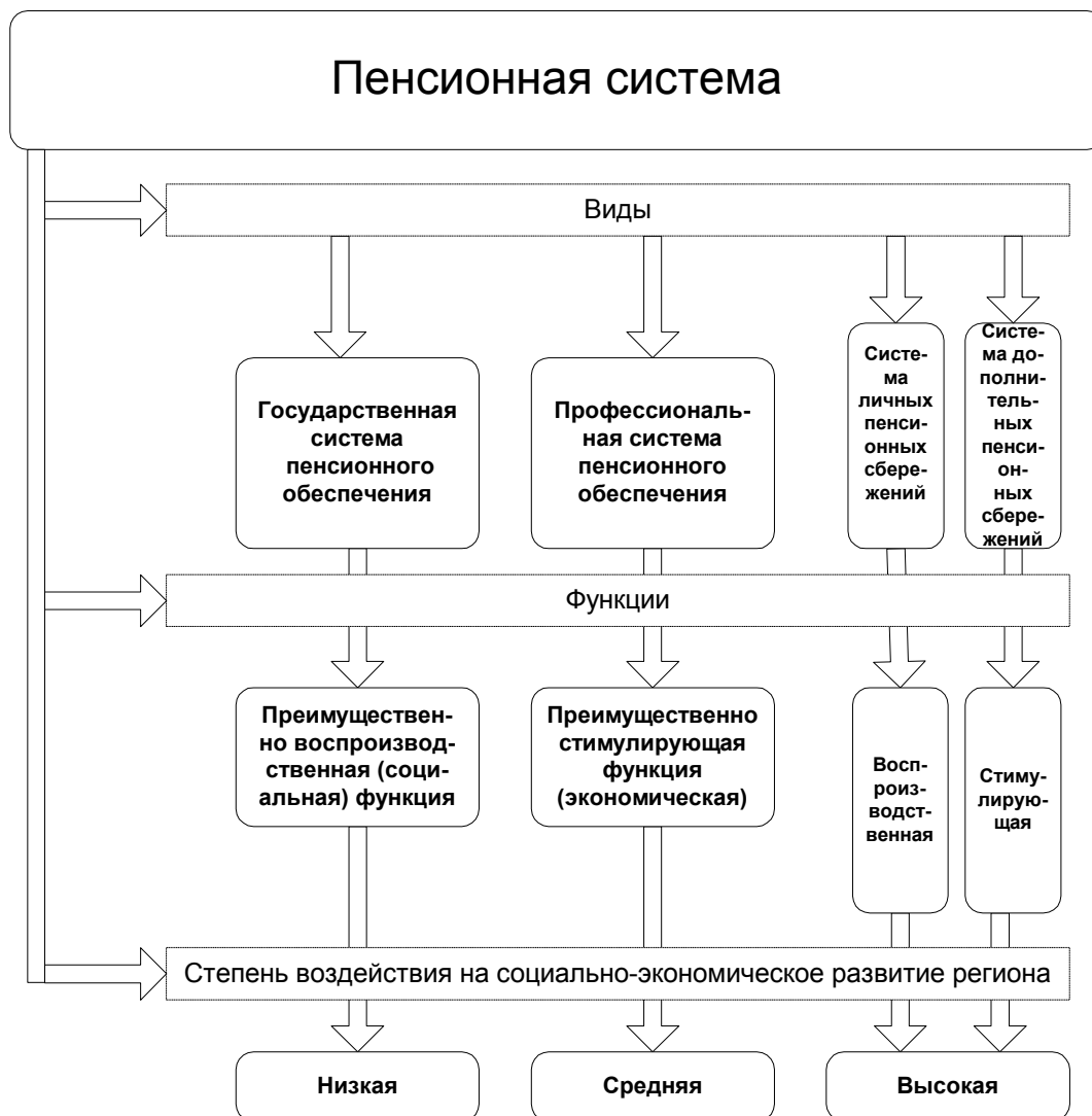
Рис. 1. Виды и функции пенсионного обеспечения по степени воздействия на процессы социально-экономического развития регионов

В организации национальных систем пенсионного обеспечения выделяются виды пенсионных систем, отличающиеся по доминирующим функциям и источникам финансирования и модели пенсионных систем, использующие разные принципы (способы) финансирования (принцип солидарности, принцип капитализации средств). Виды пенсионных систем, в силу своей специфики, обладают различными возможностями воздействия на социально-экономическую среду регионов. – рис. 1.